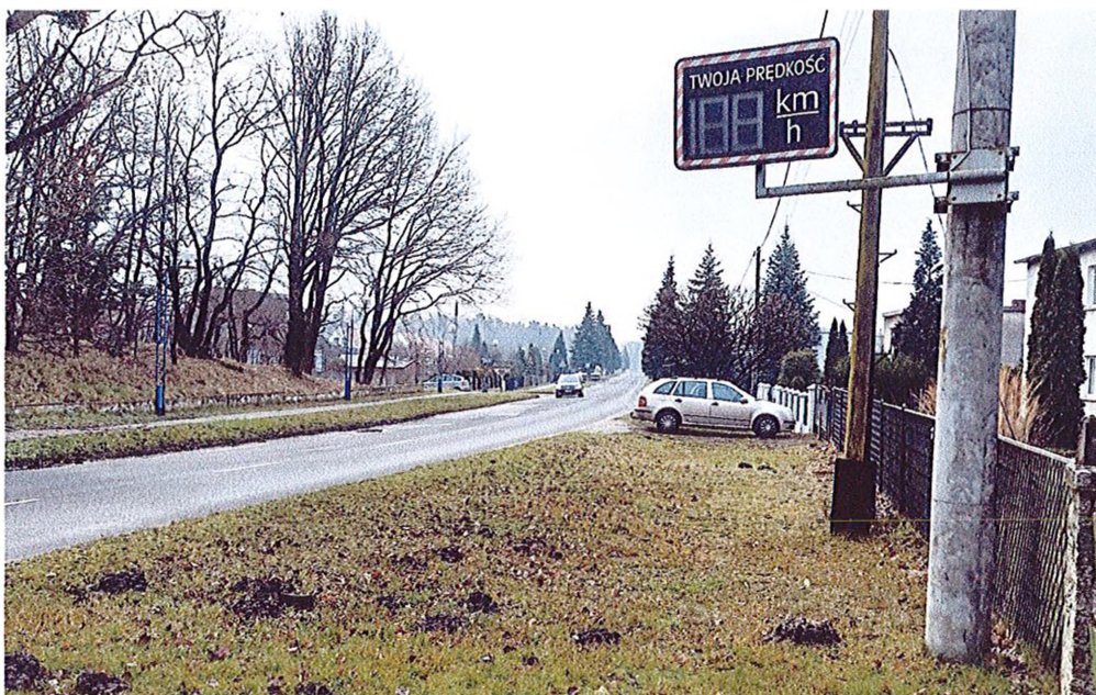
Fot. Znak "TWOJA PRĘDKOŚĆ" przy ulicy Żyrowskiej w Zdzieszowicach

Zauważyłem, że znaki „twoja prędkość” wyświetlające prędkość zbliżającego się do nich pojazdu, zlokalizowane na ul. Żyrowskiej oraz na ul. Bolesława Chrobrego nie działają. W związku z tym mam kilka pytań: