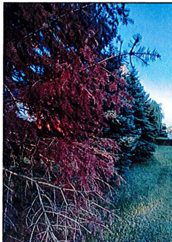
Foto. świerków przy Wspólnocie Mieszkaniowej 10

Przy Wspólnocie Mieszkaniowej Akacjowa 6 świerk jest całkowicie suchy, zwracam się z prośbą o usunięcie/wycięcie.